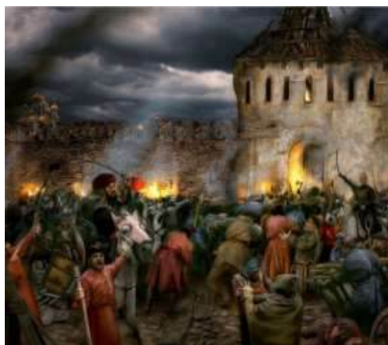
«Битва за Москву в 1612 г.»