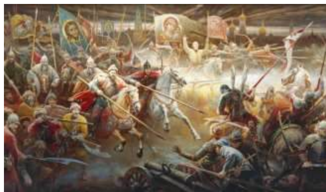
Гермоген Кречет Картина из серии «Минин и Пожарский»