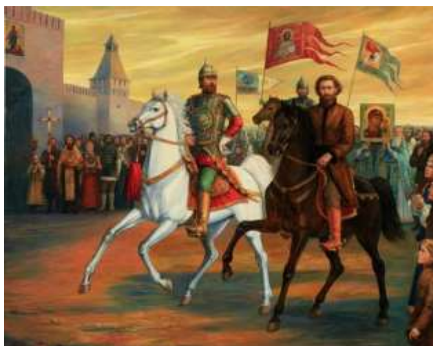
Валентина Ефимовская «Путь Спасения»