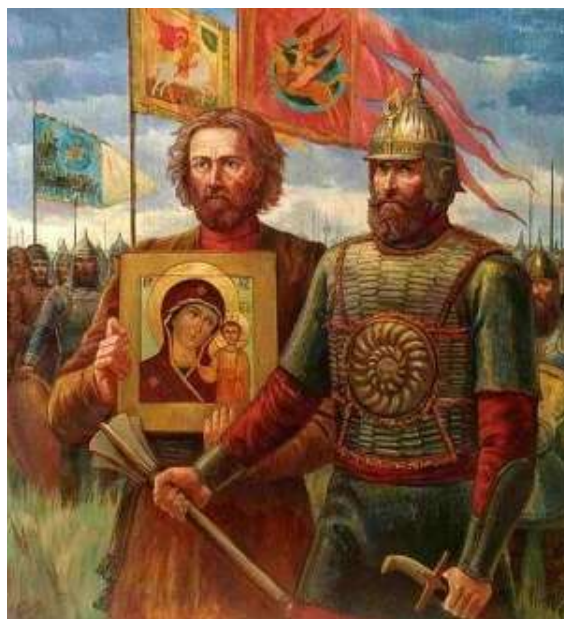
Картина «Минин и Пожарский»